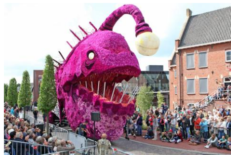
Dwaallicht - Kwintet