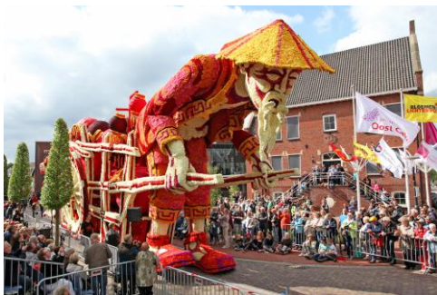
Licht Transport - Teeuws

Het onderdeel techniek wordt tegenwoordig steeds groter. Veel corsogroepen maken gebruik van hydrauliek en bewegende delen. Veelal technisch hoogstandjes. In 2017 werd 'Licht Transport van Teeuws' door corsoliefhebbers en kenners uitgeroepen tot de mooiste corsowagen van Nederland. In 2015 kreeg 'Losgeslagen' van Hooiland ook dit predicaat. Deze hoge klasseringen bevestigen de enorme kwaliteit van de wagens in het Bloemencorso. De corsobouwers leggen de lat ieder jaar weer hoger om onze bezoekers te verrassen met originele ontwerpen.